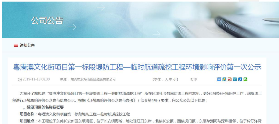
图 2.2-1 第一次网络公示截图