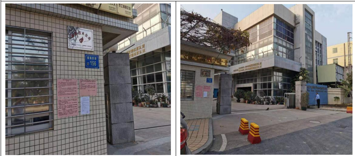
广联塑胶模具公司