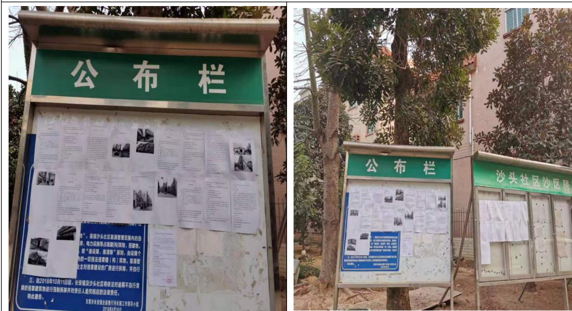
沙头社区沙区居民小组