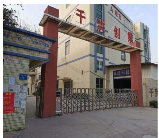
千洪创业电子公司