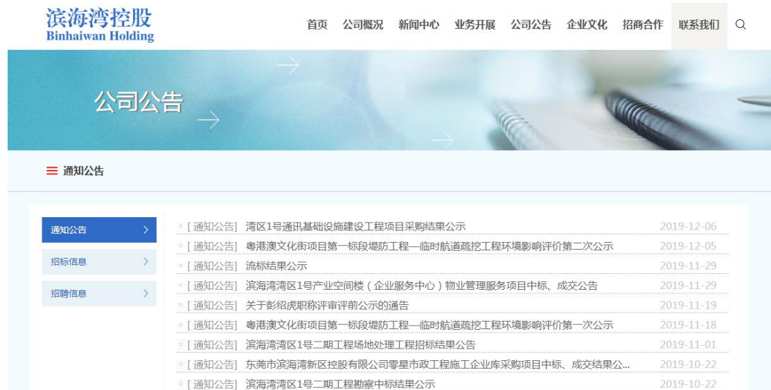
图 3.1-1 第二次网络公示截图

载体选取的符合性分析：本项目征求意见稿公示方式采用网络公示的方式，并在征求意见稿形成后，于 2019 年 12 月 05 日在建设单位主管部门的东莞市滨海湾控股有限公司网站进行公示，持续 10 个工作日，因此本项目征求意见稿公示载体的选取符合《环境影响评价公众参与办法》的要求。