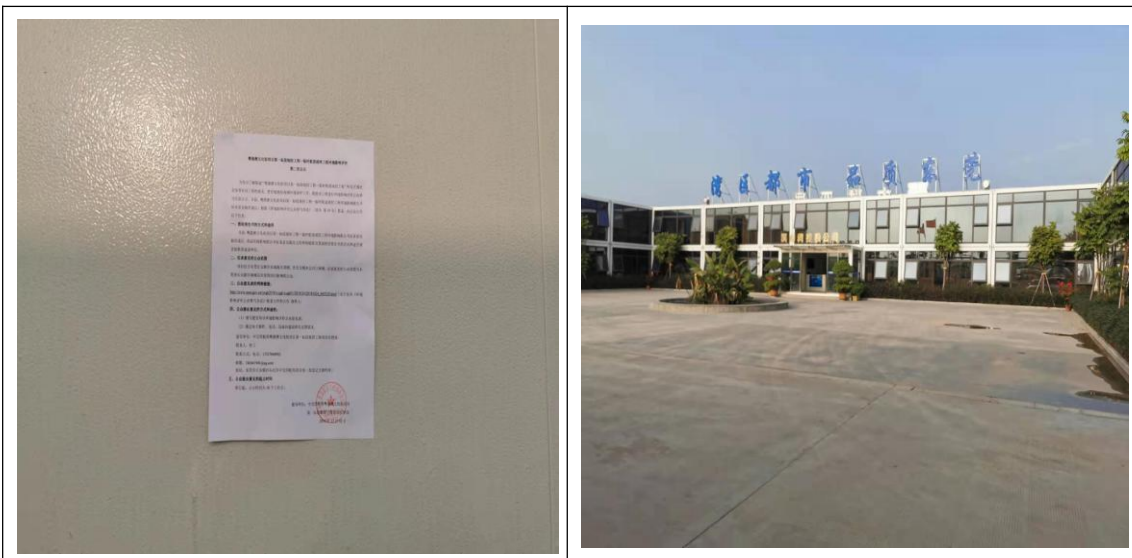
滨海湾控股有限公司

张贴区域选取的符合性分析：本项目征求意见稿公示选取本项目附近滨海湾控股有限公司、沙头社区沙区居民小组、新民村委、新天地购物广场、千洪创业电子公司、永豪电业公司、广联塑胶模具公司作为张贴取阅，于宣传栏这些易于知悉的场所张贴公告，并持续公开不少于 10 个工作日，符合《环境影响评价公众参与办法》的要求。